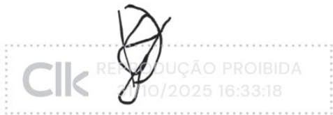
Paula Grandi Leão Coelho manuscript_31 out 2025, 16-33-15.png

Assinatura manuscrita com hash SHA256 prefixo ac2143(...)